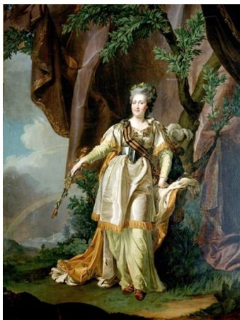
Д.Г. Левицкий. Портрет Екатерины II. 1787. Ульяновский художественный музей.

Есть другой вариант этой картины. Один хранится в Ульяновском художественном музее, другой в La Vallette во Дворце суверенного Мальтийского ордена. Там Екатерина облачена в доспехи, в руках у неё меч. Меч, правда, в ножнах, но конец этих ножен направлен в сторону черноморского пролива — Босфор, и там, на горизонте — Константинополь.