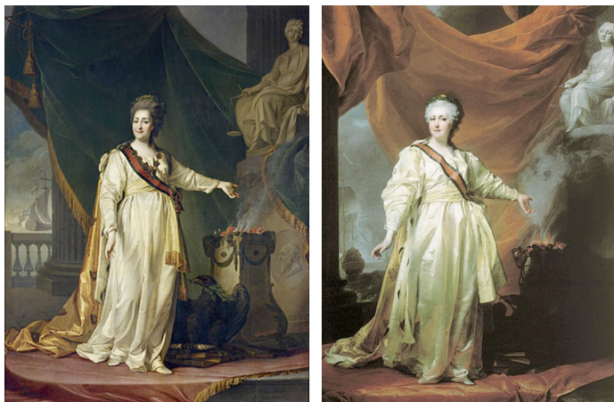
Д.Г. Левицкий. Екатерина II — законодательница в храме богини Правосудия.

В тот самый момент, когда Семён Надсон стал писать свои стихотворения, направленные против генерала Скобелева, в тот момент ещё только героя среднеазиатских походов, но не героя Русско-турецкой войны, — в этот момент империя уже стала заканчиваться, уже её конец был очевиден. Это первый момент.