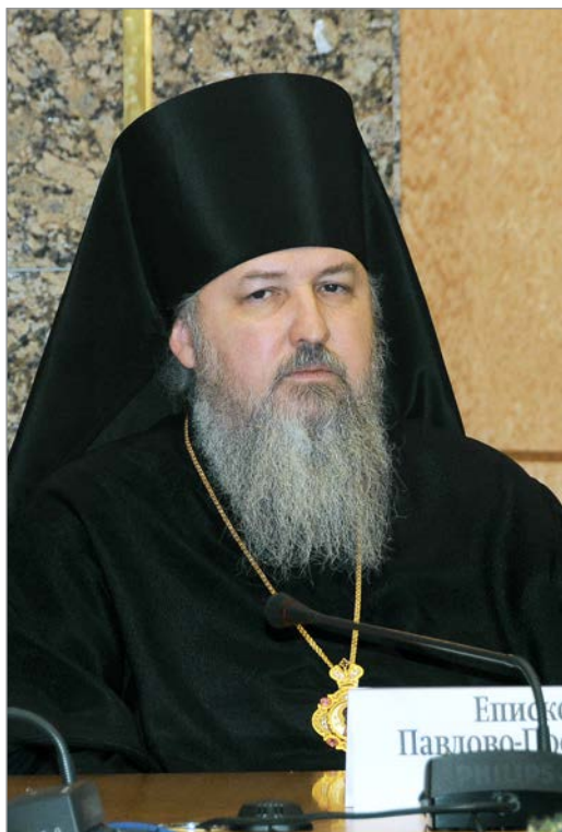
Кирилл, епископ Павлово-Посадский

павшего в войне. Это моё личное мнение — не церкви, моё личное: правда свидетельствует, что одной из причин вовлечения России в войну было предыдущее кровопролитие в России. Это метафизика, это философия, это богословие, но я считаю, что это так. Если бы не было этого кровопролития, то, я считаю, Россия, возможно, не была бы вовлечена в эту страшную Великую Отечественную войну.