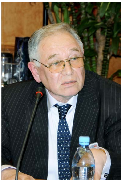
Будakov В. П.

пространства власти в пространство хаоса. При идеологическом (духовном) кризисе непременно возникала именно смута. Революцию можно рассматривать как её часть.