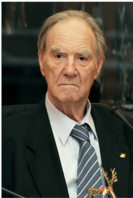
Капица С. П.