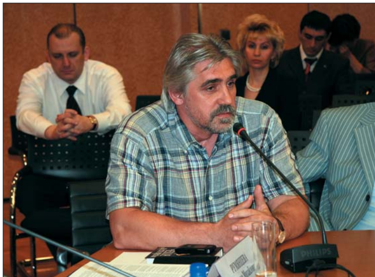
Ю. П. Голицын

твенных продуктов и практически кормила всю Европу. Нельзя сказать, что дореволюционная Россия придерживалась лозунга «Не доедим, но вывезем». Это относится к 80-м–90-м гг. XIX в., когда реформа Столыпина ещё не была осуществлена и даже задумана.